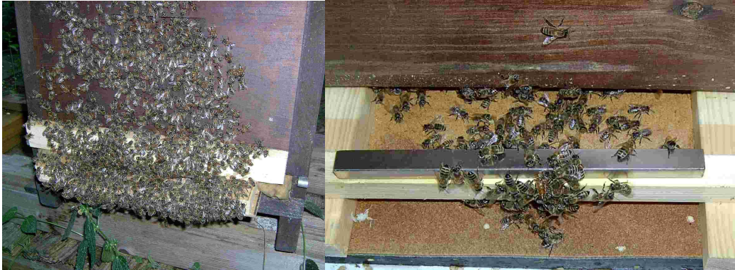
Bilder von unserem Bienenstand nach dem Schwarm

Dank unseres Apinaut Systems konnten wir dieses Jahr das Abschwärmen von Völkern verhindern. Bei allen Völkern war die Königin 1-3 Jahre alt und mit Apinaut-Plättchen gekennzeichnet. Ein Apinaut Schwarmfangstab wurde vor jedem Flugloch in ca. 10mm Fluglochhöhe eingelegt und blieb dort während der ganzen Schwarmzeit. Die Königinnen, welche schwärmen wollten, wurden dank dem Apinaut-Plättchen und dem Magneten erfolgreich abgefangen und somit konnte eine höhere Ernte gesichert werden.