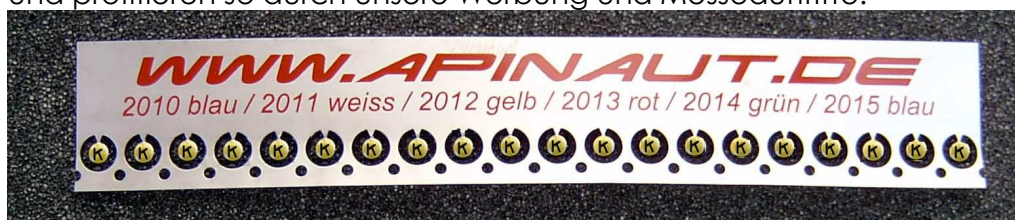
Beispiel: Züchter Königs-Bienen Druck auf Apinaut-Plättchen K